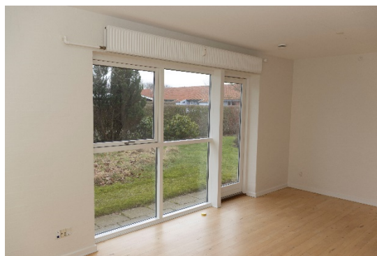
Vindues/dørparti i opholdsrum i de 6 lejemål.