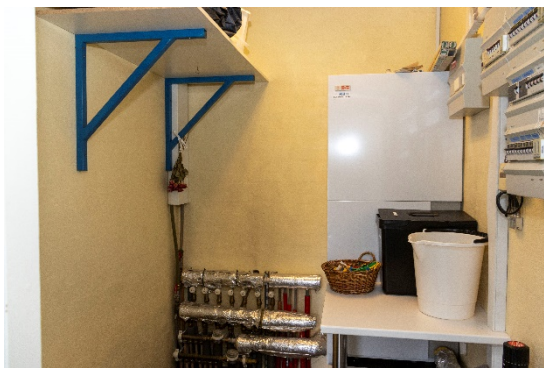
Teknik rum ved bryggers