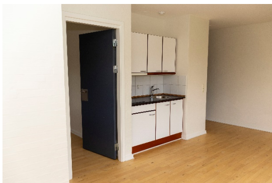
Opholdsrum/køkken i de 6 lejemål med adgang til værelse