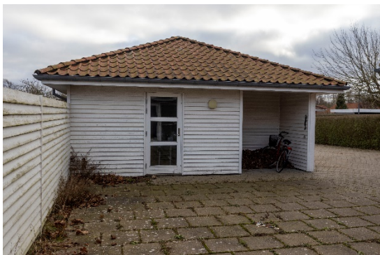
Carport/udhus set fra ejendommen mod Sneppevej