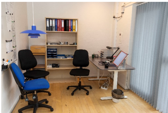
Gæsteværelse/kontor/personalerum ved indgang.