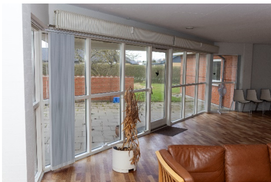
Fællesrum med vindue-/dørparti mod haven