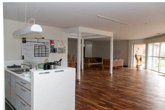
Fællesrum set fra klynge ved køkken