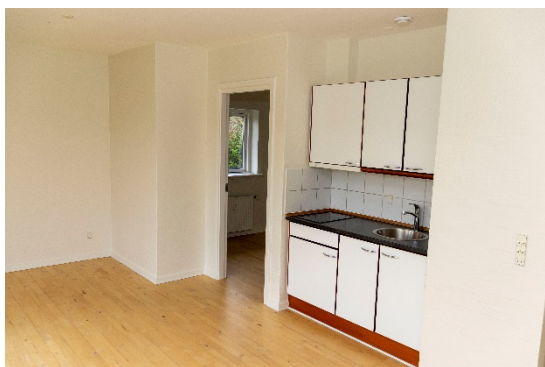
Køkken og indgang til værelse i de 6 lejemål