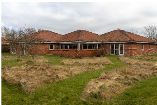
Ejendommen fra nordvest – fra haven