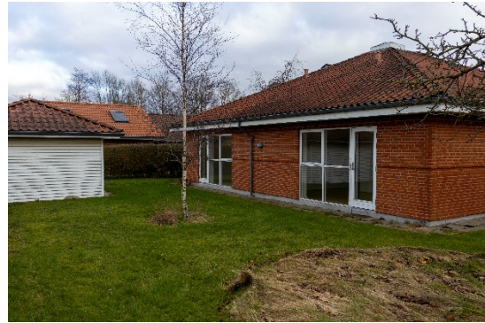
Ejendommen fra nord med indgang vinduesparti mod 2 lejemål