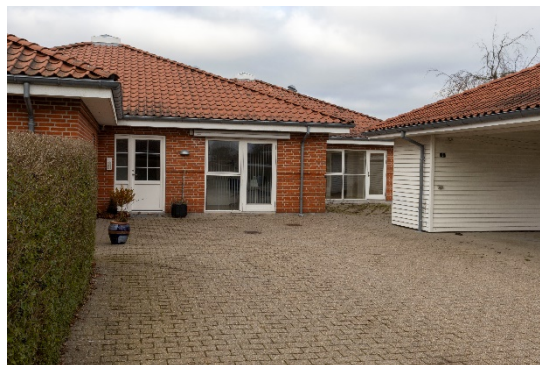
Indgangsparti – fra syd