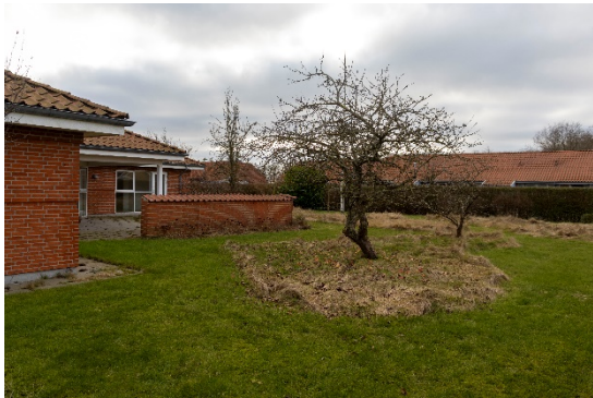
Have set fra nordøst