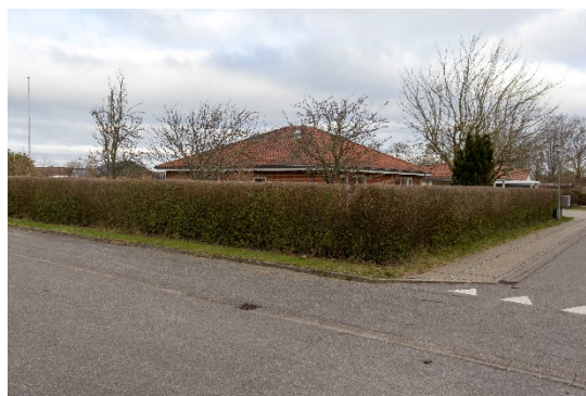
Ejendommen fra sydvest - Sneppevej