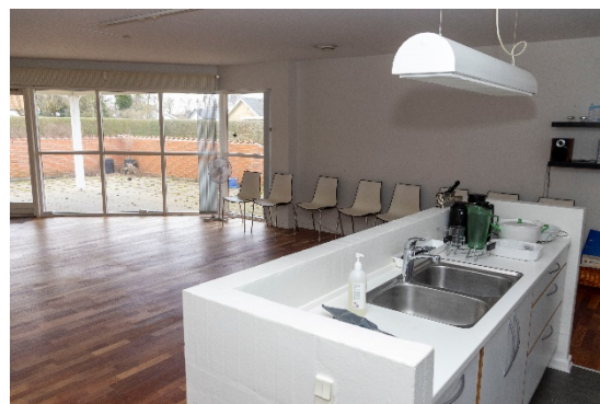
Køkken mod fællesrum