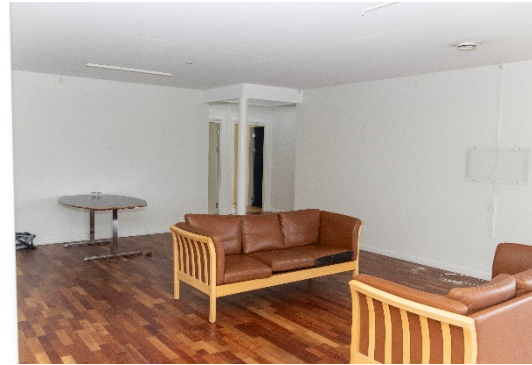
Fællesrum mod anden klynge med 3 lejemål.