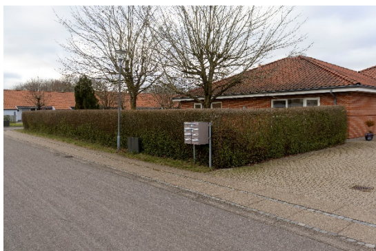
Ejendommen fra sydøst - Sneppevej

Haven er omkranset af en hæk, der gør ophold i haven meget ugeneret.