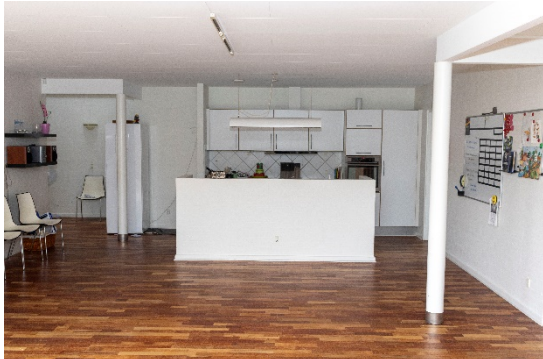
Fællesrum / køkken