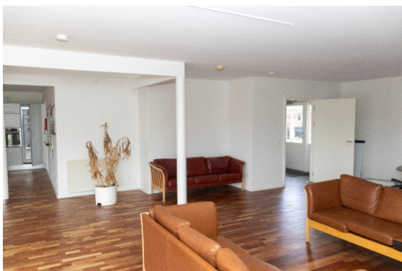
Fællesrum mod hovedindgang