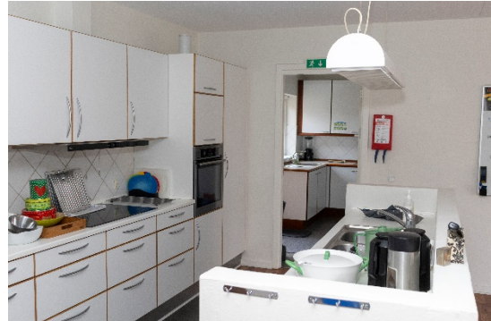
Køkken med adgang til bryggers