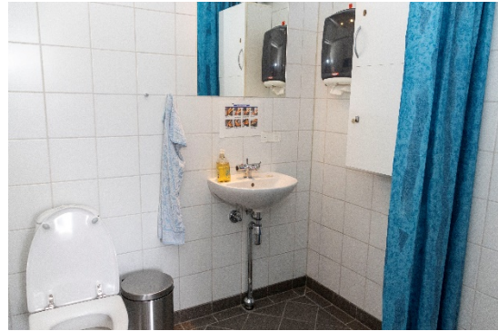
Toilet/badeværelse ved indgang/gæsteværelse