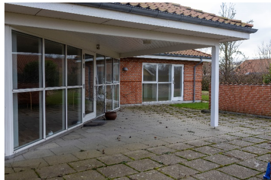
Terrasse udenfor fællesrum