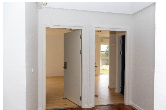
Indgang til 2 af lejemålene fra fællesrum