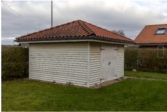
Redskabsskur i det nordøstlige hjørne.