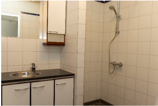
Toilet/badeværelse i de 6 lejemål