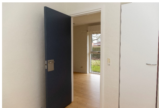
Værelse med skabe og adgang til opholdsrum i de 6 lejemål