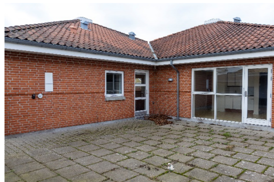
Bryggersindgang og indgang til et af lejemålene