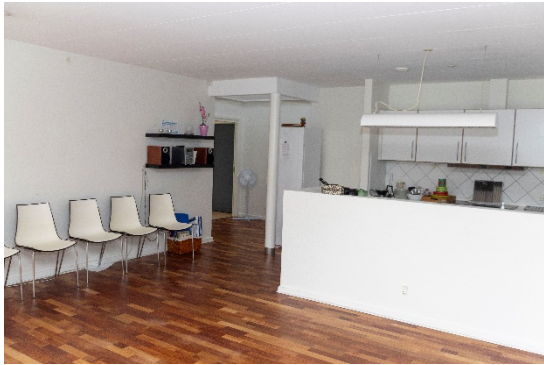
Fællesrum mod ene klynge med 3 lejemål