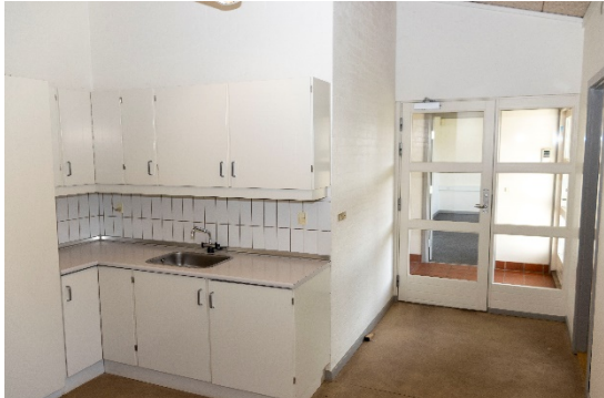
Mellemgang med mindre køkken med adgang fra foyer – vest for hovedindgang