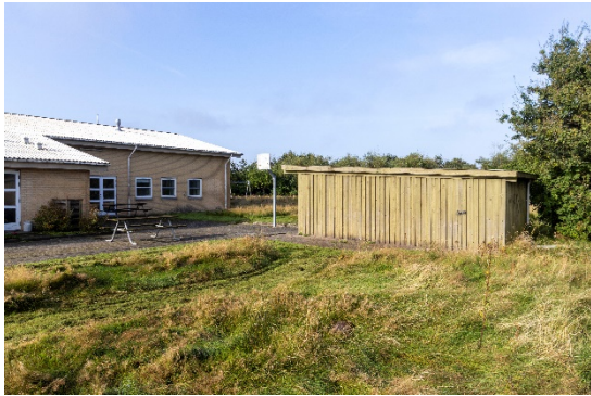
Garage/skud i den nordlige del.