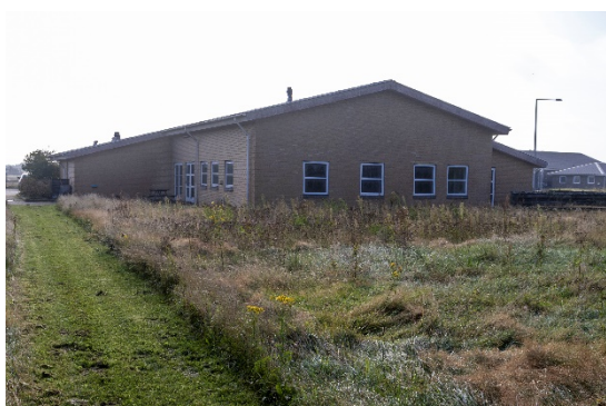
Tager fra vest