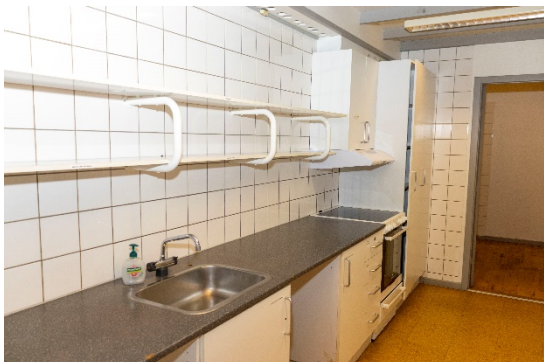
Køkken med lager/opbevaring i baggrunden