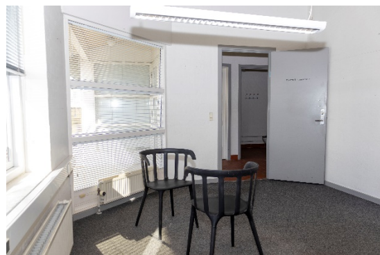
Kontor – øst for hovedindgang/foyer mod Industrivej