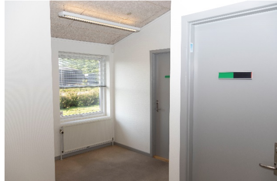
Mellemgang taget fra mindre køkken mod 2 kontorer/opholdsrum