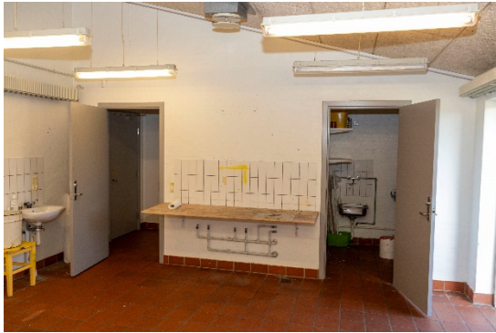
Tidligere trælærlokale med rengøringsrum og adgang til fællesrum