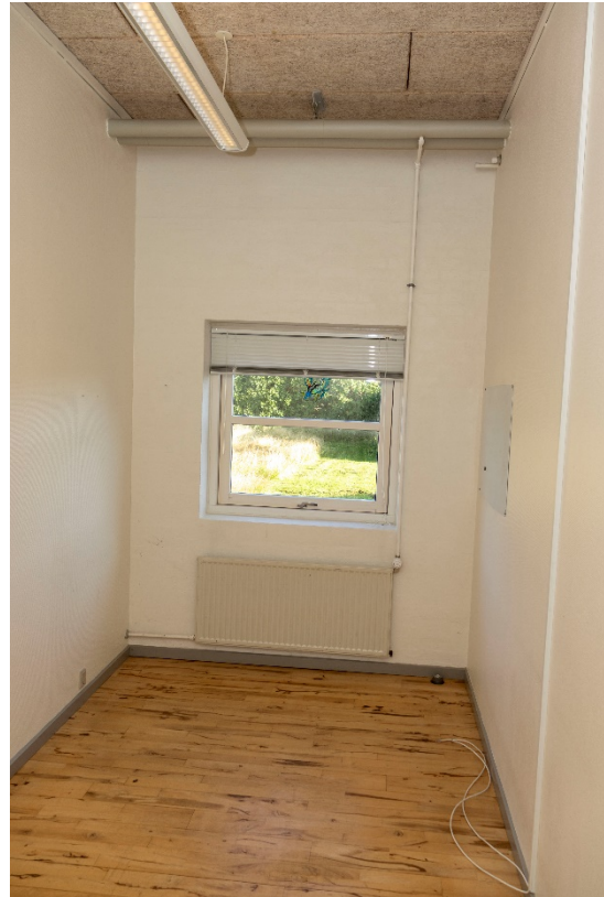
Smalt kontor/opholdsrum med adgang fra fælleslokale