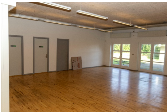
Centralt placeret fælleslokale - tager fra syd