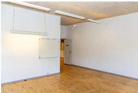
Stort kontor/undervisningslokale i nordvestlig del af bygningen.