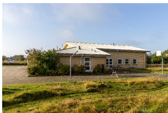
Tager fra nord