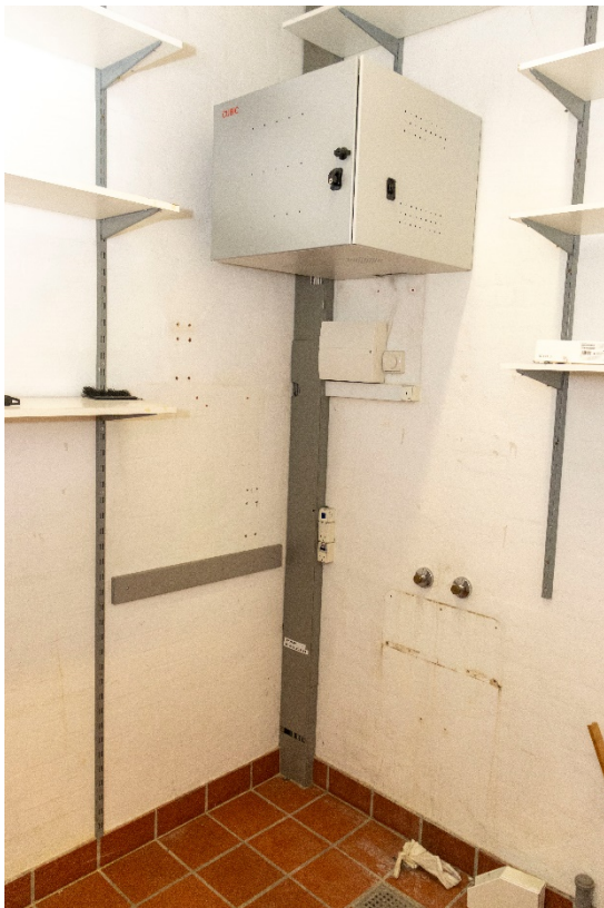
Teknik rum med adgang fra fælleslokale