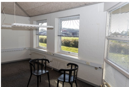
Kontor – øst for hovedindgang/foyer mod Industrivej