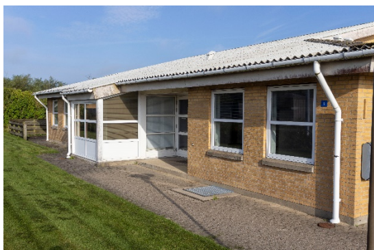
Taget fra sydøst

Endvidere er der i den vestlige del af arealet et udhus/shelter, der iflg. BBR er på 29 m 2 og opført i træ.