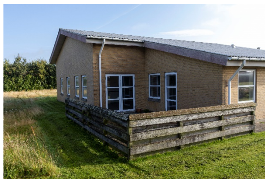
Tager fra sydvest