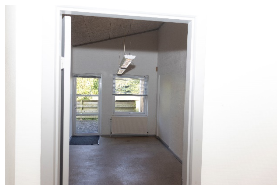
Kontor mod vest