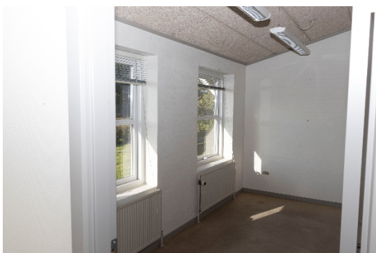
Kontor/opholdsrum i sydvestlige del af bygningen