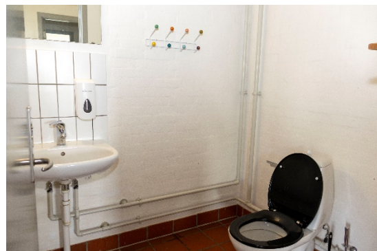
Toilet med adgang fra foyeren