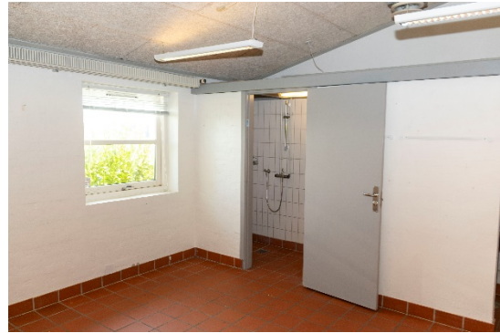
Tidligere værksted med bedefaciliteter