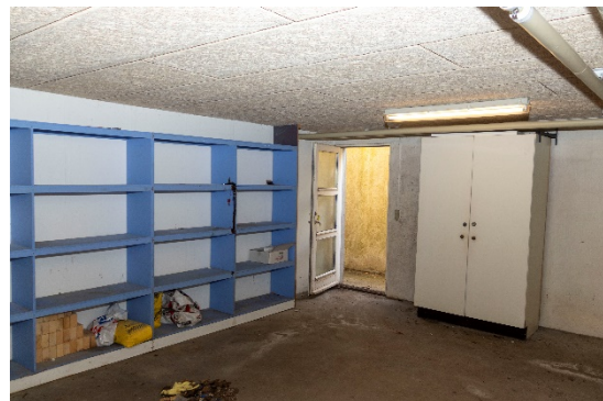
Sikringsrum/opbevaring i kælderen