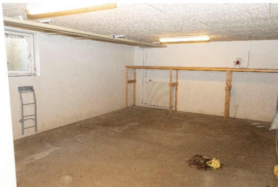
Sikringsrum/opbevaring i kælderen