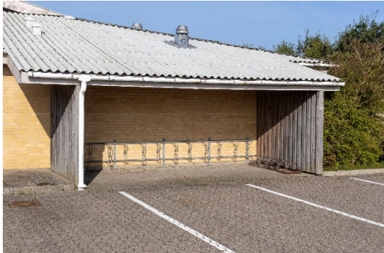
Overdækket cykelskur beliggende mod øst