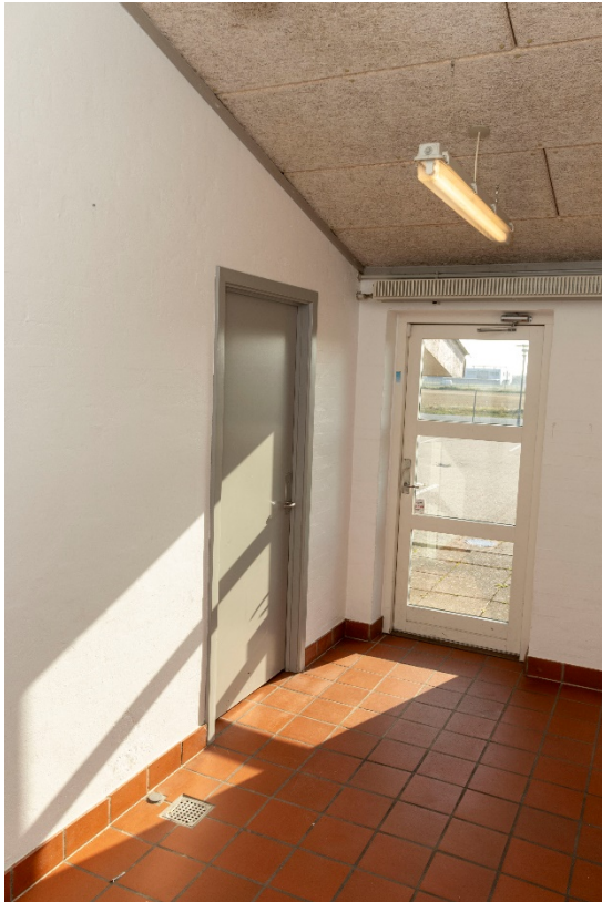
Mellemgang ved værksted