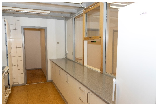
Køkken med åbning mod fælleslokale