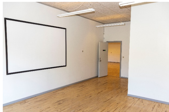
Stort kontor/undervisningslokale mod vest