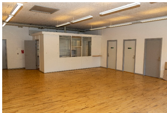
Centralt fælleslokale med køkken i baggrunden