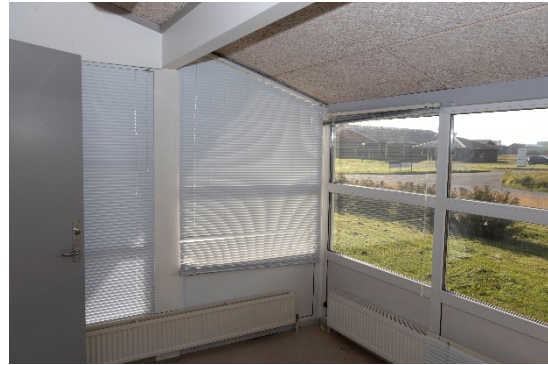
Mindre kontor/opholdsrum – vest for hovedindgang.