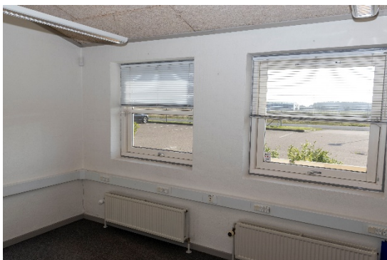
Kontor med adgang fra foyeren