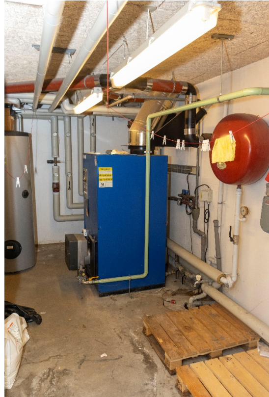
Teknik rum i kælderen