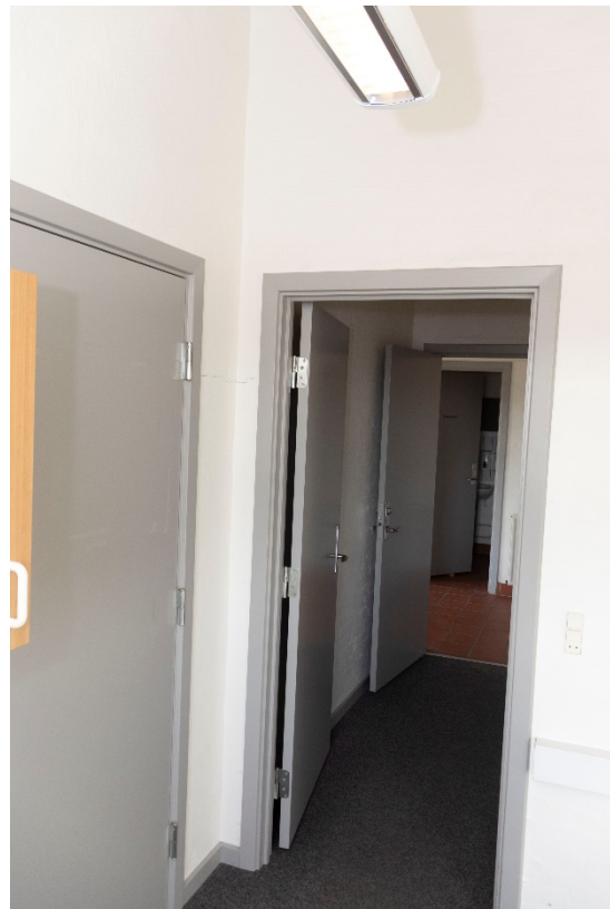
Garderobe – taget fra kontor mod foyer