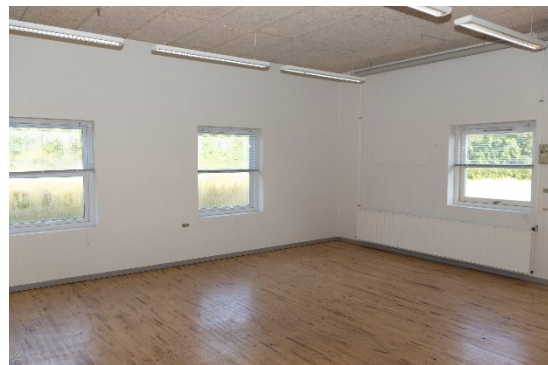
Stort kontor/undervisningslokale i nordvestlig del af bygningen