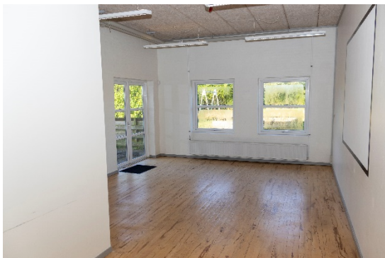
Stort kontor/undervisningslokale mod vest