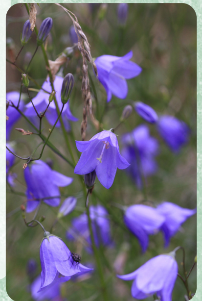
Liden Klokke 1

Sommerhusområderne i den kystnære del af kommunen rummer stor variation, og her findes ofte både tørre heder, våde lavninger og vindblæste klitter. I mange af sommerhusområderne er jorden mager og sandet og derfor hjemsted for mange nøjsomme arter, der trives bedst i hårde kår, hvor andre almindelige arter ikke trives.