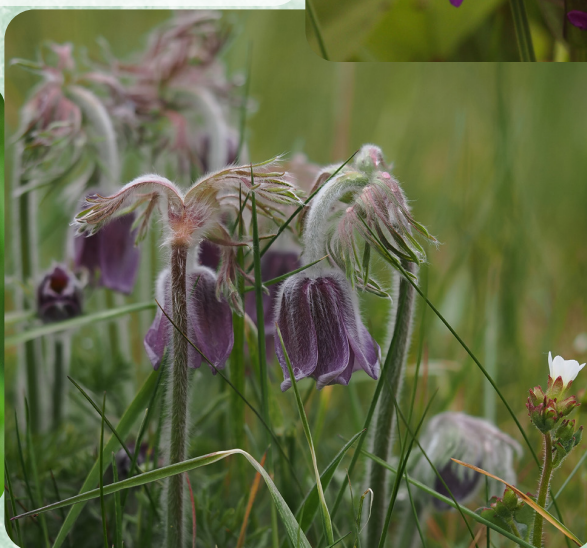
Nikkende kobjælde